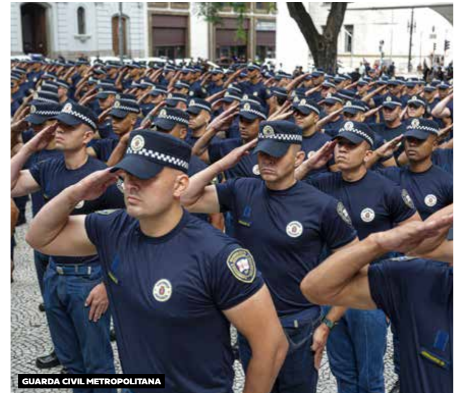
GUARDA CIVIL METROPOLITANA

Propomos um conjunto de estratégias para fortalecer a segurança e ordem urbana, com foco na prevenção e integração. Uma abordagem e uma visão ampla sobre segurança pública que visa agir na raiz do problema, reduzindo a vulnerabilidade dos jovens ao crime organizado, também, por meio da ampliação do acesso às atividades educacionais, culturais e esportivas. Além disso, continuaremos a fortalecer a Guarda Civil Metropolitana (GCM) com aumento do efetivo, modernização de equipamentos e treinamento contínuo, reorganizando a estrutura territorial do centro e garantindo mais guardas na periferia. Avançaremos na gestão integrada entre diferentes órgãos, ampliando e fortalecendo as ações em parceria com o governo estadual e a sociedade civil. Fortaleceremos as ações voltadas à proteção de nossas crianças, com o aumento da presença da GCM em horários e locais estratégicos, como escolas, fazendo a ronda escolar. Ampliaremos as ações preventivas e protetivas às mulheres, crianças e idosos vítimas de violência. A expansão do programa de videomonitoramento