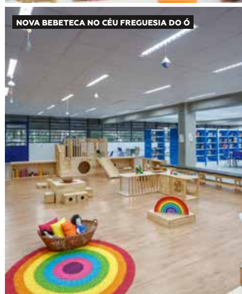
NOVA BEBETECA NO CÉU FREGUESIA DO Ó