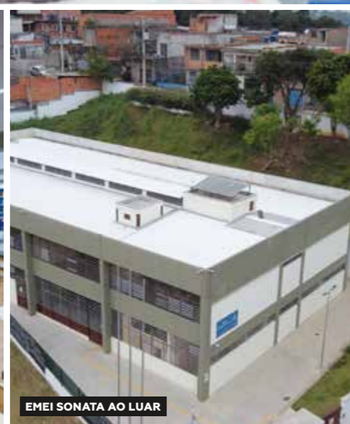
EMEI SONATA AO LUAR

Com o maior sistema de ensino municipal do país, não possuímos fila da creche pelo quarto ano consecutivo, criamos mais de 100 mil novas vagas e garantimos a vaga do bebê na rede municipal antes mesmo do nascimento. Além disso, construímos e reformamos escolas e Centros Educacionais Unificados (CEUs), equipamos salas de aula com tecnologia, ampliamos o sinal de internet de 30 mbps para 100 mbps e aumentamos o investimento em manutenção. Implementamos também programas de saúde ocular, facilitamos o transporte escolar gratuito, mudamos o modelo de compra centralizada para disponibilização de créditos às famílias dos alunos para compra de uniforme e material escolar, com maior liberdade de escolha dos itens e fortalecimento do comércio local, além da geração de empregos. Lançamos um aplicativo de segurança para escolas e intensificamos a busca ativa por alunos faltosos. Avançamos no ensino integral e técnico, valorizamos os professores com aumento salarial e benefícios, instituímos a Gratificação de Local de Trabalho (GLT) para fixar professores em escolas com maior rotatividade, e nomeamos mais de 15 mil novos servidores para suprir necessidades